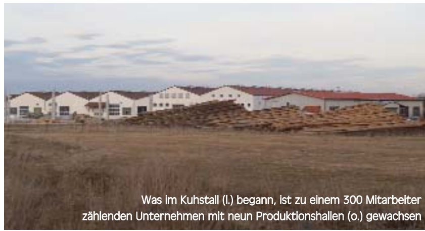
Was im Kuhstall (l.) begann, ist zu einem 300 Mitarbeiter zählenden Unternehmen mit neun Produktionshallen (o.) gewachsen